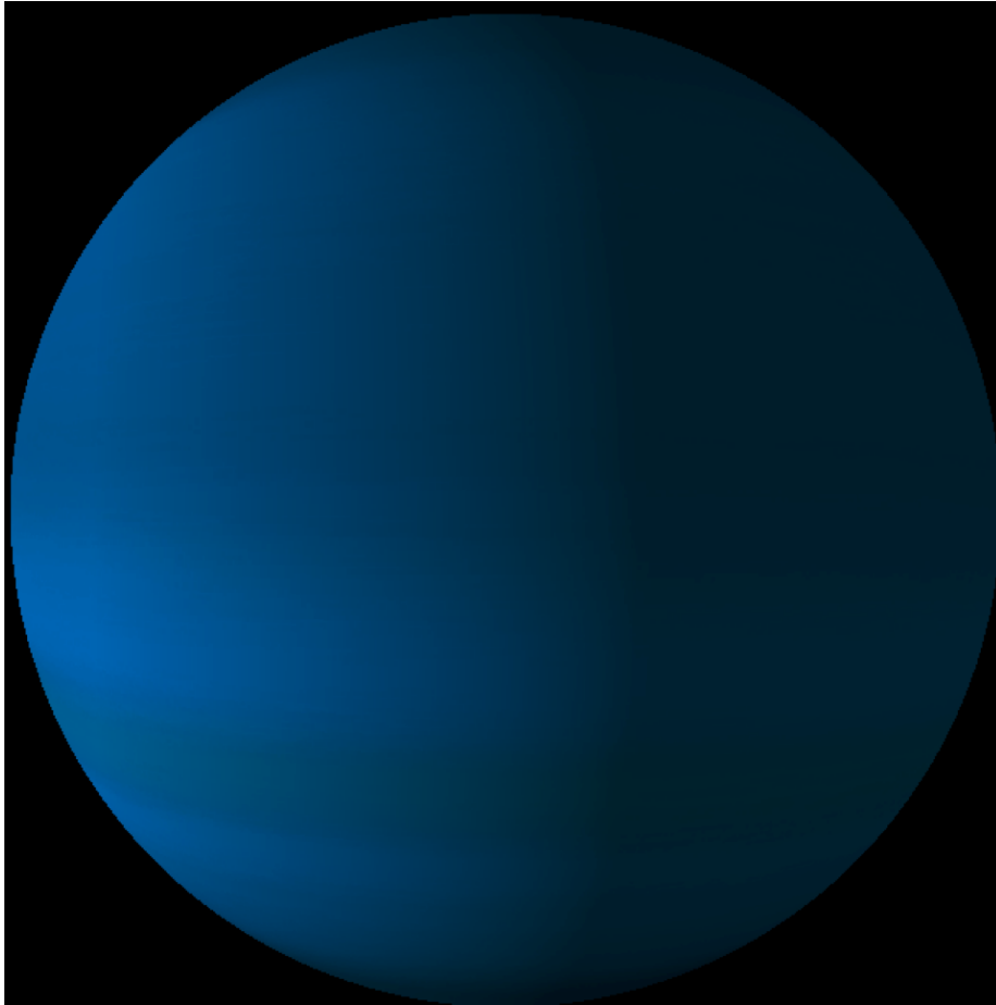
ภาพจำลองดาวเคราะห์นอกระบบสุริยะ GJ3470b